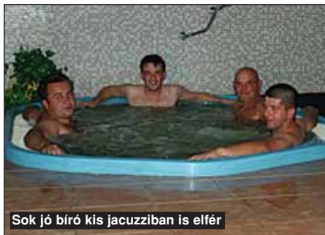
Sok jó bírós kis jacuzziban is elfér