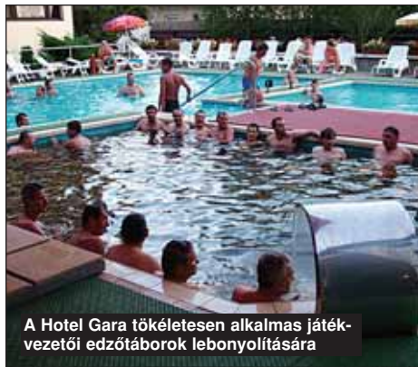
A Hotel Gara tökéletesen alkalmas játékvezetői edzőtáborok lebonyolítására