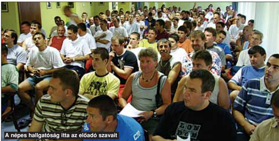
A népes hallgatóság itta az előadó szavait