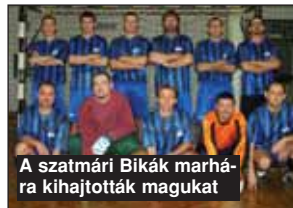
A szatmári Bikák marhára kihajtották magukat

boltban dolgozik az egykori NB-s bírós. – A játékvezetés a szenvedélyem volt. Imádtam a labdarúgást, szerettem egyedül lenni, e kettő a pálya közepén valósulhatott meg. Egyetlen síppal érhetem el a tőkeletes magányt: senkihez sem tartoztam, mégis min-