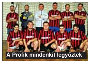
A Profik mindenkit legyőztek