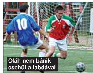
Oláh nem bánik csehül a labdával