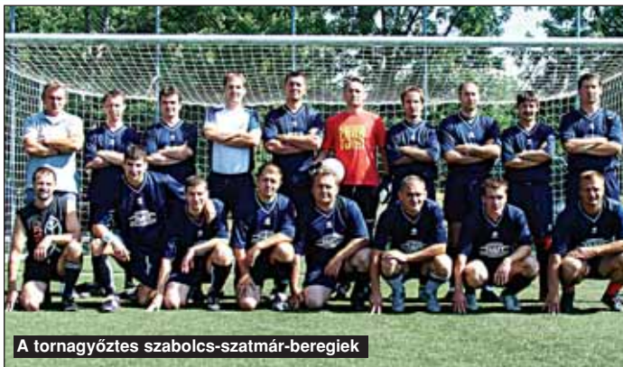
A tornagyőztes szabolcs-szatmár-beregiek