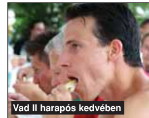
Vad II harapós kedvében