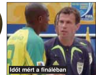
Időt mért a fináléban