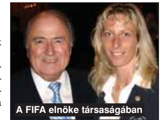
A FIFA elnöke társaságában

Februárban a magyar labdarúgás történetében először ő vezetett először hölgyként az élvonalban, a Kaposvár—Vác bajnokin fújta a sípot.