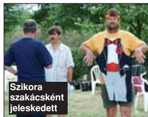
Szikora szakácsként jeleskedett