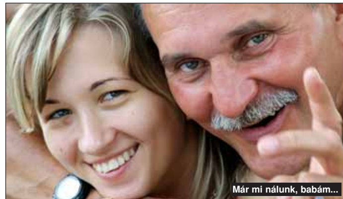
Már mi nálunk, babám...