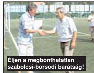
Éljen a megbonthatatlan szabolcsi-borsodi barátság!